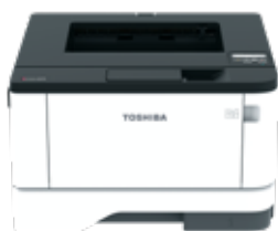
550 Blatt Zusatzkassette*