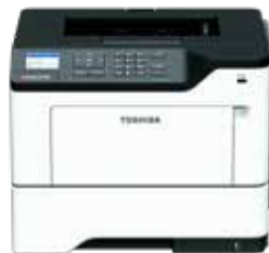
550 Blatt Zusatzkassette**