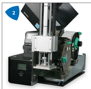
2 Kompakt, sicher und leichter Zugang für den Bediener.