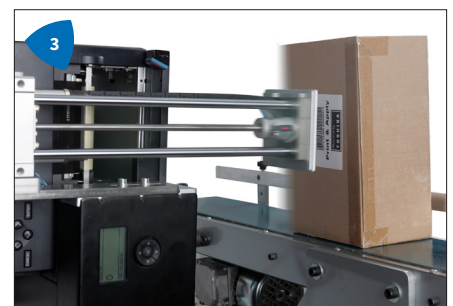
3 Vielseitiger Einsatz durch Aufbringen der Etiketten von oben, unten, seitlich und in beliebigen Winkeln.